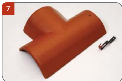
Rozdělovací hřebenáč levý T 250 s jednou příchytkou Pro kolmé napojení dvou hřebenů v jedné rovině.