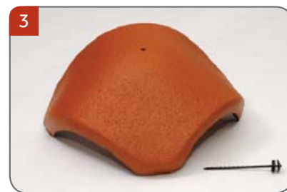
Rozdělovací hřebenáč s jedním vrutem Pro napojení hřebene a dvou nároží.