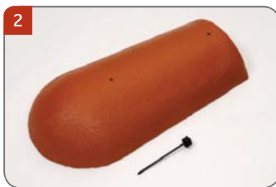
Koncový hřebenáč s jedním vrutem Pro spodní zakončení nároží.