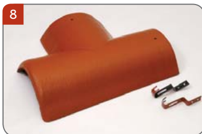
Rozdělovací hřebenáč levý T 220 se dvěma příchytkami Pro kolmé napojení dvou hřebenů v jedné rovině.