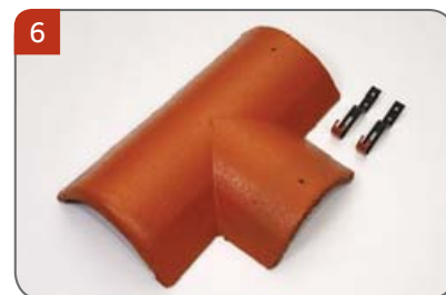
Rozdělovací hřebenáč pravý T 220 se dvěma příchytkami Pro kolmé napojení dvou hřebenů v jedné rovině.