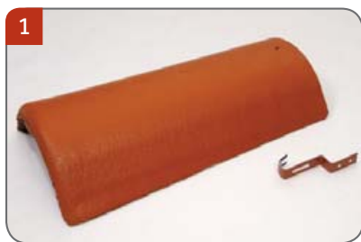
Hřebenáč s jednou příchytkou Pro pokrývání hřebene a nároží.