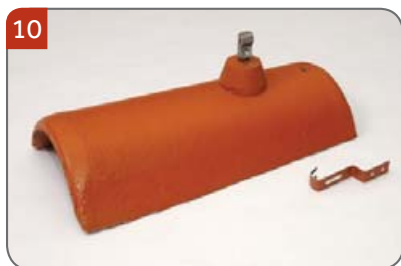
Hromosvodový hřebenáč s jednou příchytkou Pro upevnění vodiče hromosvodu na hřebeni a nároží.