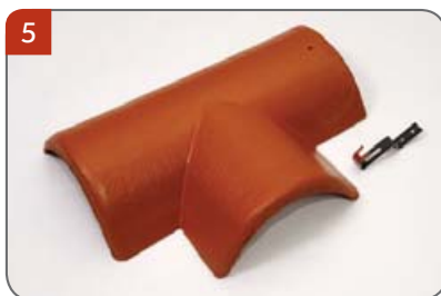
Rozdělovací hřebenáč pravý T 250 s jednou příchytkou Pro kolmé napojení dvou hřebenů v jedné rovině.